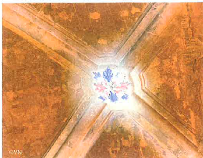
Grâce aux travaux, de magnifiques détails sont apparus !

26 avril : première représentation, Le Sourire de Darwin avec Isabella Rossellini.