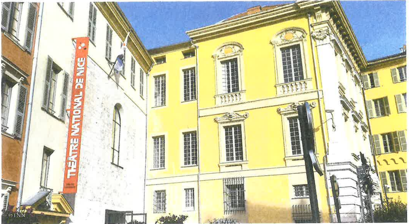
La façade, sobre mais magnifiquement restaurée.