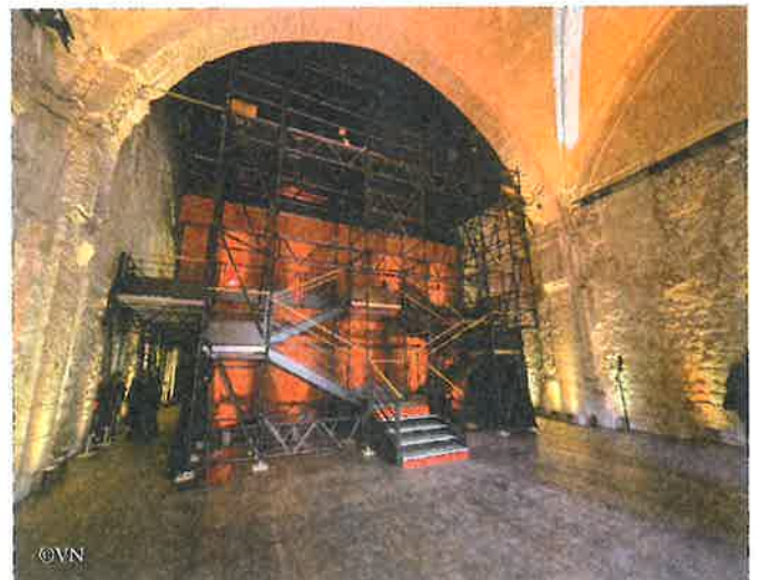
L'espace technique de la nouvelle salle.