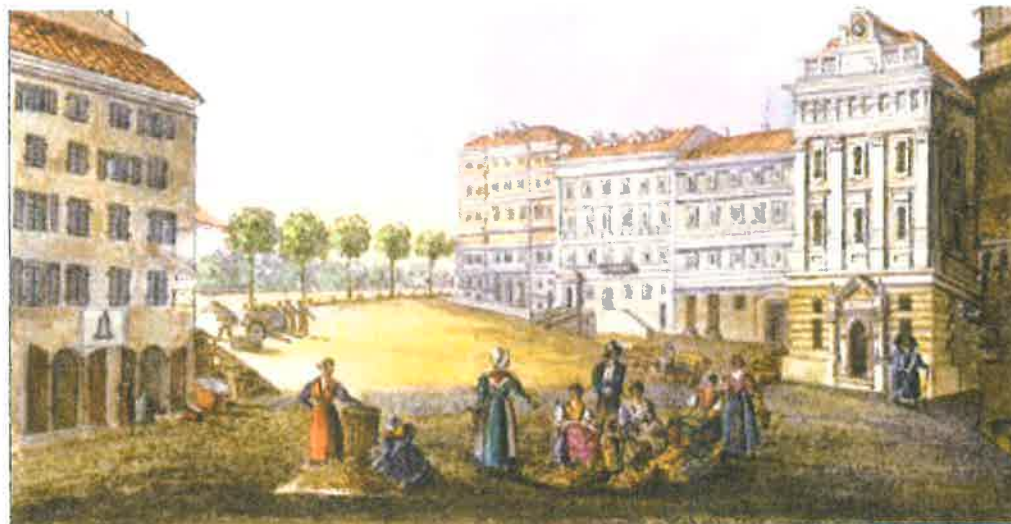
La place Saint-François et le Palais communal Aquarelle de Clément Roassal, vers 1830, 18 x 28 cm (Nice, musée Masséna, reproduction Ville de Nice, MAH-9047)